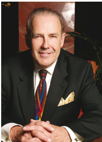
JOHN TSCHOHL Presidente

Después de 39 años de experiencia, Service Quality Institute es el líder global en ayudar a las organizaciones a crear una cultura de servicio, construida alrededor del Facultamiento de los empleados para subir el nivel de servicio al cliente y solucionar sus problemas de manera rápida y decisiva. Este es el máximo nivel a alcanzar para ofrecer un servicio excepcional al cliente.